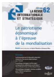
LA REVUE INTERNATIONALE ET STRATÉGIQUE N°62 - été 2006