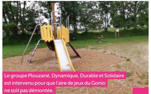
Le groupe Plouzané, Dynamique, Durable et Solidaire est intervenu pour que l'aire de jeux du Gonio ne soit pas démontée.

Une ville a besoin de lieux de distraction, de détente et de rencontres. Les aires de jeux sont des lieux de rassemblement ludiques pour y venir en famille ou entre amis. Elles favorisent la créativité, la motricité, les interactions sociales, apprennent le respect... Elles sont également appréciées des assistantes maternelles. C'est aussi une façon de valoriser le patrimoine communal. Plouzané, 13 800 habitants, étendue sur plusieurs pôles, a besoin de tels espaces. Si nous bénéficions aujourd'hui des parcs Paul Lareur et Pencoed, récemment réaménagés, le parc Jacques Brel, la toile d'araignée et les